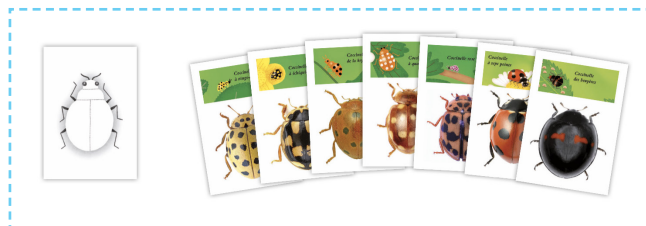
Matériel fourni pour les tables 1 à 7